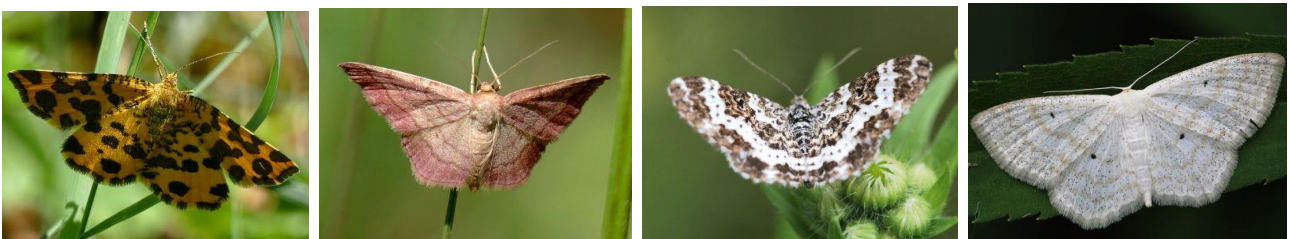
Pantherspanner und Violetter Kleinspanner

In den Monaten April bis Juni traten zahlreiche Edelfalter-Arten in Erscheinung. Allmählich kamen die Bläulinge und Weißlinge dazu. Doch zuletzt waren es die Spanner, Zünsler, Eulenfalter und Bärenspinner, die das Repertoire auffüllten, zumeist tagaktive Nachfalter.