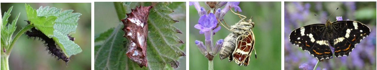
Landkärtchen-Raupe, Landkärtchen-Puppe, frisch geschlüpft, Landkärtchen-Falter (Sommergeneration)

In einzelnen Fällen konnte auch die Metamorphose von der Raupe über die Puppe bis zum erwachsenen Falter erfasst werden.