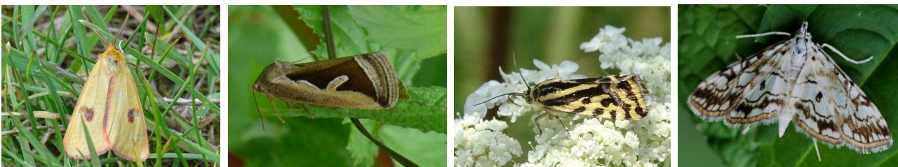
Rotrandbär (© C. Streichhahn) Ried-Grasmotteneulchen (© R. Hertweck), Ackerwinden-Bunteulchen (© C. Streichhahn), Laichkraut-Zünsler (© S. Kühn)